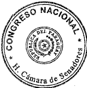
Fernando Lugo Méndez Presidente H. Cámara de Senadores